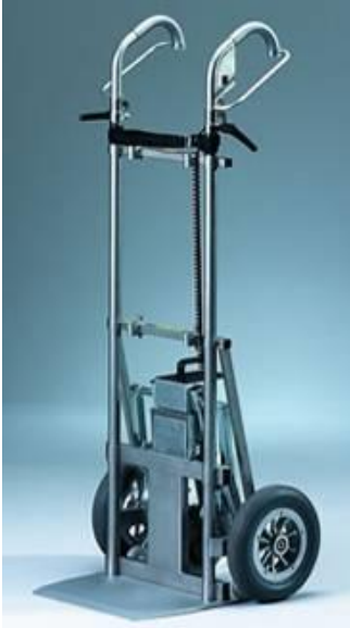
Een steekkar met een mechanisch trappenloperssysteem