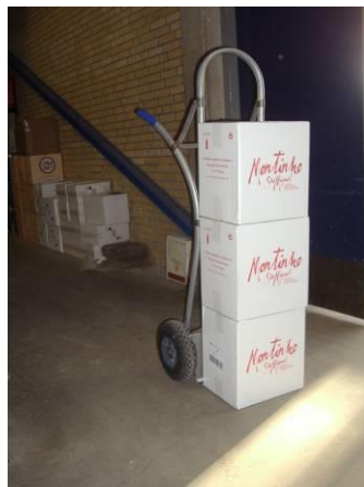
Een opklapbare steekwagen