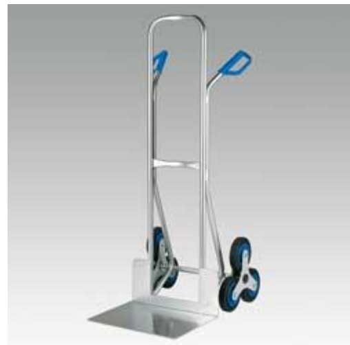
Voorbeelden van handmatige kratten trapsteekwagens met sterwielen